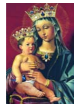
Heliga Maria av Freden, i kyrkans absid.