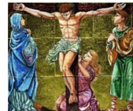
Korsvägen, XII:e stationen: Jesus dör på Korset, keramik

titel: Regina pacis, ora pro nobis! - Du fredens drottning, bed för oss! Har du åtminstone försökt att göra det när du förlorar ditt lugn ...? Du kommer att bli förvånad över hur omedelbart det verkar.