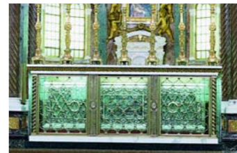
Altaret där den helige Josemarías kvarlevor vilar.

Jungfru Maria är - så åkallar Kyrkan henne - fredens Drottning. När det råder oro i din själ, i din familj eller på din arbetsplats, i den samhällsliga samvaron eller mellan nationer, skall du därför inte upphöra att vända dig till henne med den