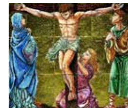
Korsveien, 12. stasjon: JJesus dør på korset, keramikk.

slutte med å henvende deg til henne med tittelen: Regina pacis, ora pro nobis! – Du fredens dronning, be for oss! Har du i det minste prøvd å gjøre det når du mister sinnsro-en ...? Du kommer til å bli forbauset over hvor umiddelbart det virker.