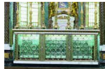
Alteret der den hellige Josemarías legeme hviler.

Jomfru Maria er – slik påkaller Kirken henne – fredens dronning. Når det er uro i din sjel, i din familie, eller på din arbeidsplass, i de samfunnsmessige forhold eller mellom nasjoner, må du derfor ikke