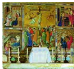
Kapellet med det aller helligste sakrament