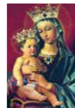
Den hellige Maria av Freden, i kirkens apsis.