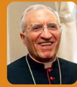
Cardenal Rouco Varela