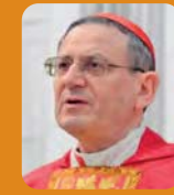
Cardenal Angelo Amato

Preside el cardenal Angelo Amato, Prefecto de la Congregación para las Causas de los Santos