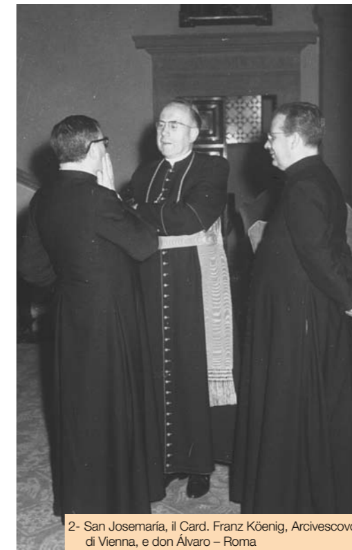
2- San Josemaría, il Card. Franz König, Arcivescovo di Vienna, e don Álvaro – Roma

Non è facile descrivere l'impegno richiesto a tutti i membri della Commissione dalla effettuazione di questo lavoro in un lasso di tempo così ridotto. Non è semplice neppure immaginare il compito che dovette svolgere don Álvaro, Segretario di quel gruppo di lavoro: coordinare la Commissione conciliare, formata da personalità di rilievo nel mondo ecclesiastico e teologico, non era per nulla facile. Il Servo di Dio seppe ascoltare le diverse proposte, valutare gli aspetti positivi di ognuna di esse, smussare le posizioni contrarie fino a trovare