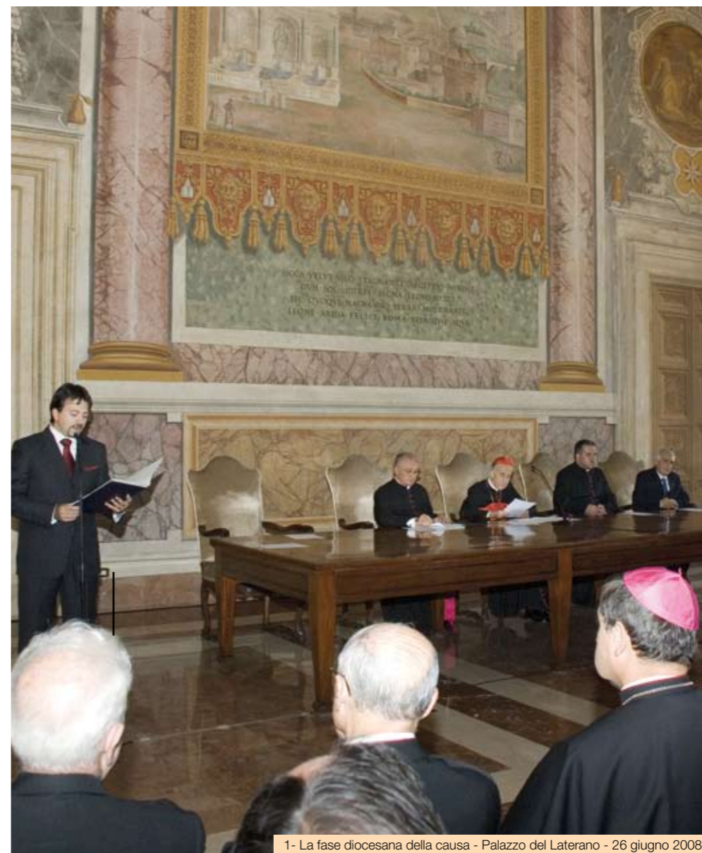
1- La fase diocesana della causa - Palazzo del Laterano - 26 giugno 2008