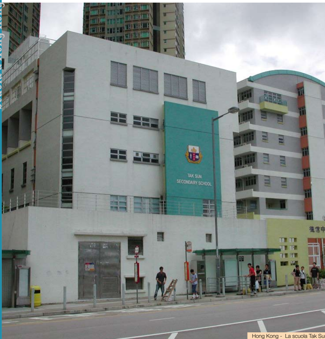
Hong Kong - La scuola Tak Sun

Tak Sun Secondary School, a Hong Kong, una iniziativa educativa nata per impulso di don Álvaro.