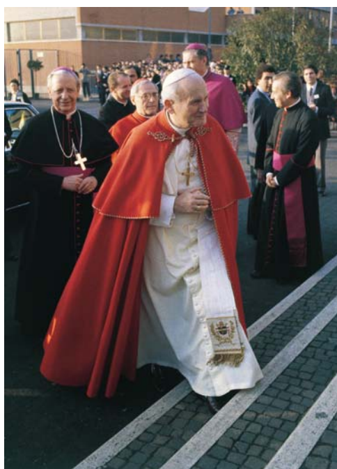
• Visita del Santo Padre al centro ELIS, Roma (1984).

Mons. Echevarría lo ringraziò a nome dell'Opus Dei per questa prova di profonda benevolenza. Il beato Giovanni Paolo II rispose, in italiano, che lo considerava un dovere: « Si doveva, si doveva », furono le sue parole. ▲