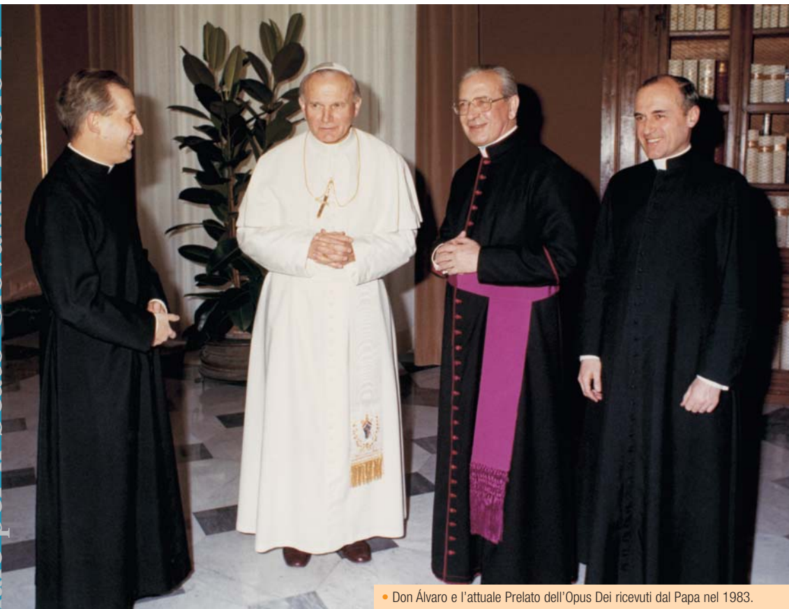
• Don Álvaro e l'attuale Prelato dell'Opus Dei ricevuti dal Papa nel 1983.

In data 28 novembre 1982, il Santo Padre Giovanni Paolo II, mediante la Costituzione apostolica Ut sit , eresse l'Opus Dei come Prelatura personale e nominò Prelato mons. Álvaro del Portillo. Il 6 gennaio 1991 gli conferì l'Ordinazione episcopale nella Basilica di S. Pietro. Non era soltanto un riconoscimento verso la persona, ma un provvedimento del tutto coerente con la peculiare missione che compete al Prelato dell'Opus Dei nella Chiesa.