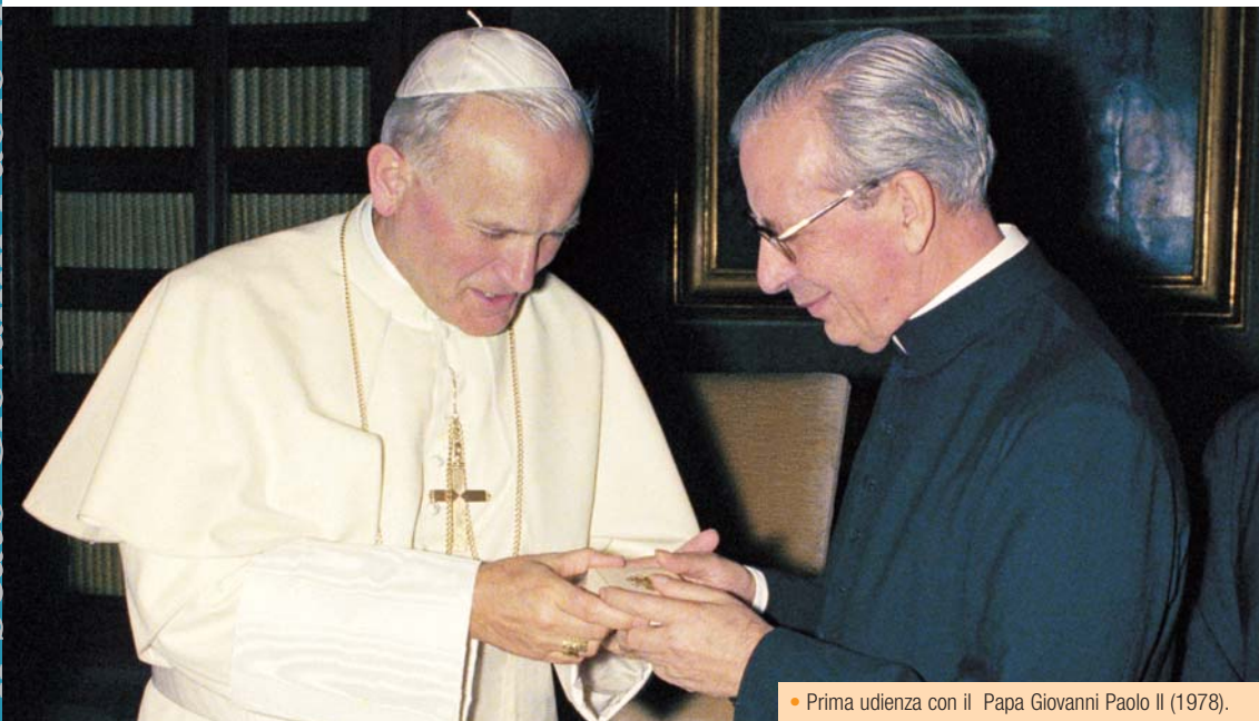
• Prima udienza con il Papa Giovanni Paolo II (1978).