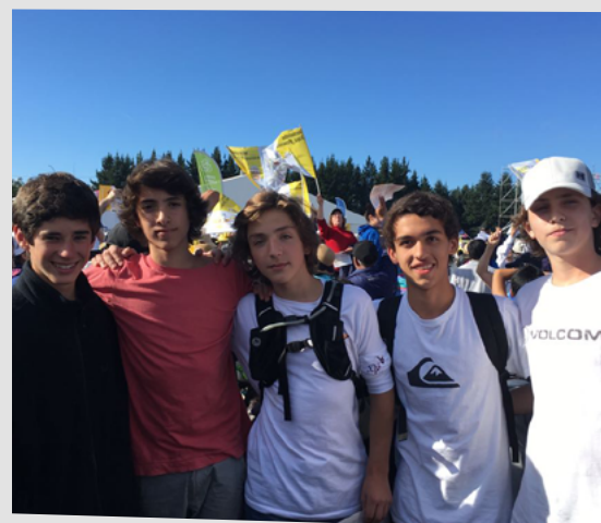
Integrantes del club Lonquimay en Temuco esperando al Papa.