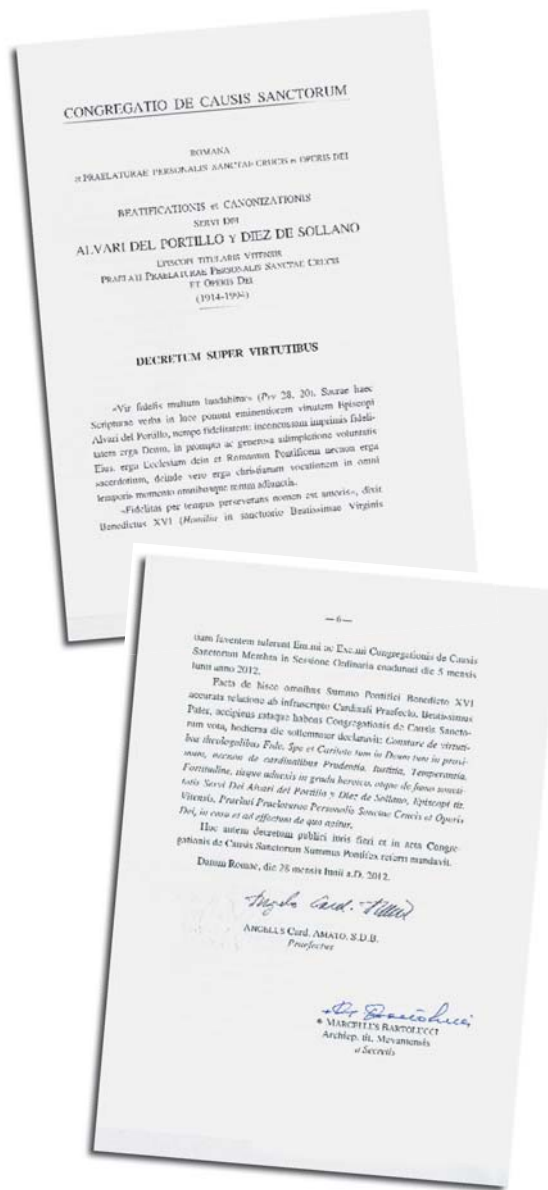
• Fotografia della prima e dell'ultima pagina del Decreto della Congregazione delle Cause dei Santi che dichiara l'eroicità delle virtù di don Alvaro.

cessore di san Josemaría alla guida dell'Opus Dei. Fece della continuità nell'applicazione degli insegnamenti del Fondatore il punto