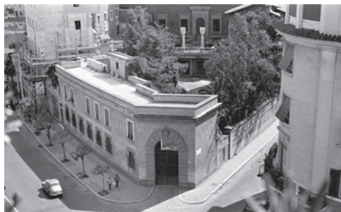
El Pensionato en los años cincuenta.