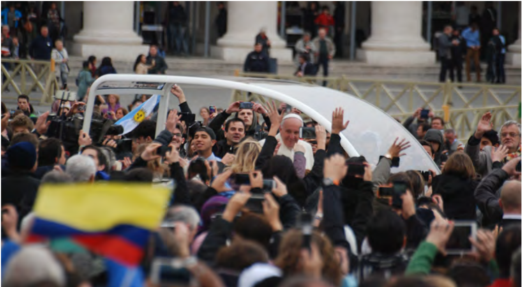
El Papa Francesc, al costat de joves de tot el món abans de l'audiència del passat Congrés Universitari Internacional UNIV'2016.

“Estimats joves, tinc el gust d’anunciar-vos que al més d’octubre de 2018 se celebrarà el Sínode dels Bisbes sobre el tema «els joves, la fe i el discerniment vocacional». He volgut que ocupeu el centre de l’atenció, perquè us porto al cor”. Així comença la carta del Papa Francesc, datada el 13 de gener de 2017, dirigida als joves del món, en la qual expressa una prioritat clara de tota l’Església.