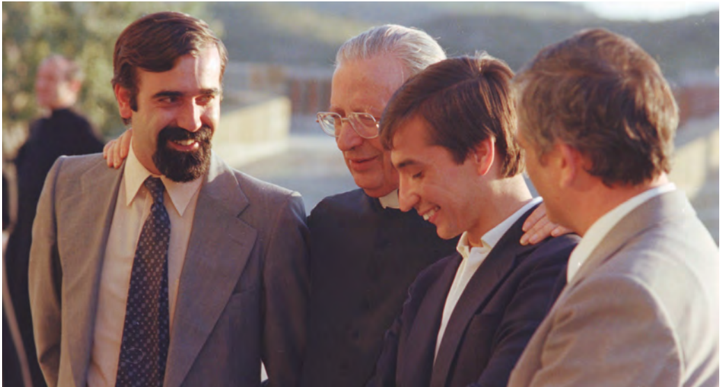
Àlvar del Portillo, a Torreciudad