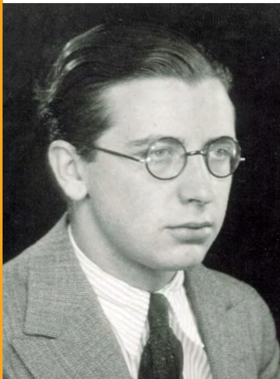
El beat Àlvar, el 1937

A continuació es recullen alguns textos del beat Àlvar del Portillo sobre l'etapa de la joventut i la resposta al compromís total amb la vida cristiana.