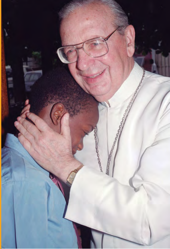
Mons. Àlvar del Portillo, amb un noi nigerià

Jesús, no ho oblidem, s'entendria davant les multituds que caminaven errants, com ovelles sense pastor, i es preocupava de cada persona que es creuava en el seu camí". 3