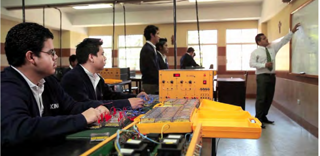
Joves rebent una classe a Kinal

Kinal va iniciar les seves activitats el 1961 amb un grup de paletes i fusters d'un suburbi marginal de Guatemala. El beat Àlvar del Portillo va ser-ne impulsor directe. Actualment, 1.500 joves reben una formació tècnica que els permet aconseguir una feina per tirar endavant la seva família.