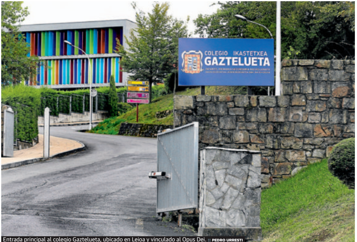
Entrada principal al colegio Gaztelueta, ubicado en Leioa y vinculado al Opus Dei.

Tanto la familia del joven como el profesor acusado y el colegio Gaztelueta ya tienen conocimiento de la 'sentencia' del juicio canónico abierto por Roma. Según se recoge en la documentación conocida por este periódico, la Congregación para la Doctrina de la Fe puso el 9 de marzo en manos de un investigador experto en este tipo de casos el estudio de la documentación enviada por la familia al Papa. Anteriormente, el propio Opus Dei ya había realizado unas primeras indagaciones de manera interna que, según diversas fuentes, apuntaron a que las acu-